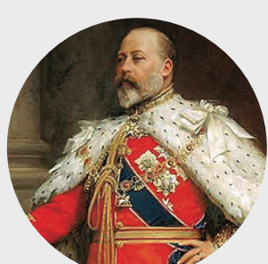
Eduardo VII 1841-1910