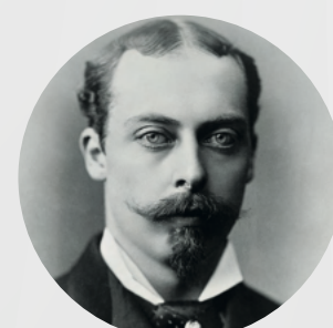
Leopoldo 1853-1884 Hemofilia